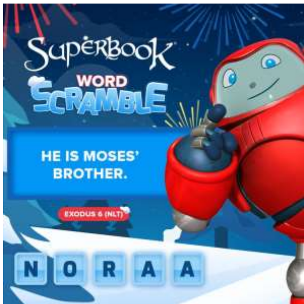
Gambar 1. Games Di superbook

Dengan adanya film serial superbook ini maka guru semakin dipermudah, sebab sudah ada perbulannya dalam pemakaian untuk firman Tuhan, jadi para gereja dan guru-guru sekolah minggu tentunya harus menerapkan firman Tuhan ini melalui media digital, sudah saatnya anak-anak sekolah minggu bangkit untuk bisa mendengarkan firman Tuhan yang sesuai kebutuhannya, bukan hanya itu saja dalam filmnyapun ada games, pertanyaan yang tentu menaik dan asyik.