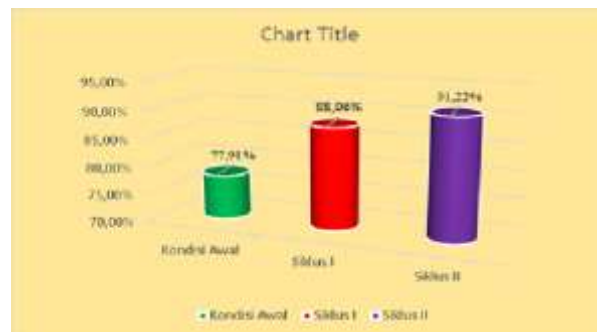
Gambar 1. Persentase ketuntasan hasil belajar Pendidikan Agama Kristen

Ketuntasan prestasi belajar Pendidikan Agama Kristen juga mengalami peningkatan. Grafik berikut menggambarkan ketuntasan prestasi belajar Pendidikan Agama Kristen dalam bentuk perentase.