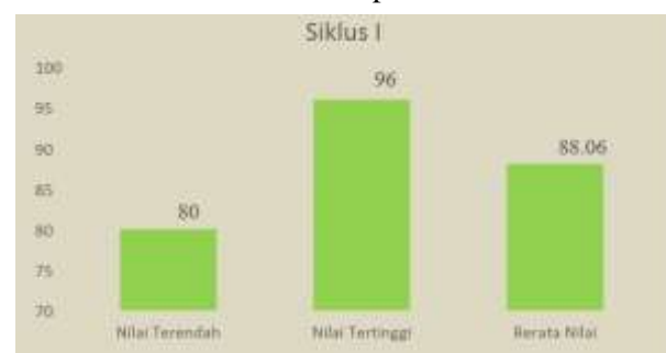
Tabel 1. Siklus 1 implementasi PTK

Hasil siklus pertama memberikan peningkatan yang cukup baik terhadap hasil belajar siswa. Namun, masih ada ketuntasan yang kurang dari beberapa siswa. Itu sebabnya, tim pelaksana melakukan siklus II agar hasil belajar siswa-siswi maksimal.