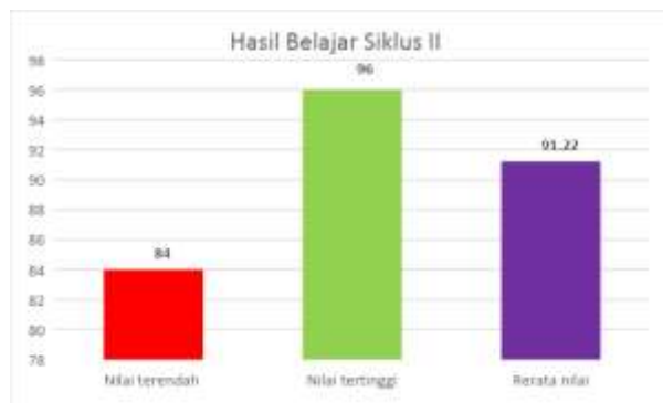
Grafik 2. Grafik prestasi belajar Pendidikan Agama Kristen Siklus II

Hasil pengamatan menunjukkan bahwa pelaksanaan metode pembelajaran PAKEM berdampak pada prestasi belajar Pendidikan Agama Kristen. Prestasi belajar Pendidikan Agama Kristen yang diperoleh oleh peserta didik menunjukkan peningkatan dari kondisi awal, siklus I dan siklus II. Peningkatan prestasi belajar Pendidikan Agama Kristen peserta didik dapat dilihat pada tabel berikut: