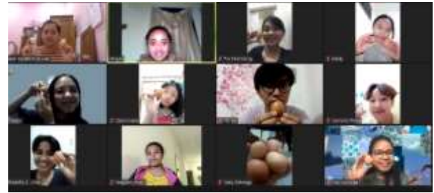
Gambar 2. Perayaan Paskah Kristus

Diskusi mengenai firman Tuhan berdasarkan film tersebut dilakukan sesuai menonton yang dilakukan secara interaktif oleh kelompok sebagai kakak pembina dan kemudian dilanjutkan oleh gembala lokal. Kelompok mengamati bahwa strategi tersebut berhasil untuk menarik minat anak-anak JC hingga kemudian memperoleh nilai-nilai dan pesan firman Tuhan secara utuh. Adapun salah satu indikator keberhasilan program yang telah dilaksanakan oleh kelompok diukur dari ekspresi dan respon setiap anak-anak JC yang terlihat atraktif dan ikut bergabung kembali dalam pertemuan berikutnya. Lebih dari itu, terdapat penambahan jiwa selama kelompok mengadakan pembinaan program ibadah kreatif di GBI AKR Sore yang dapat dijadikan salah satu indikator keberhasilan program kreatif yang telah dilaksanakan.