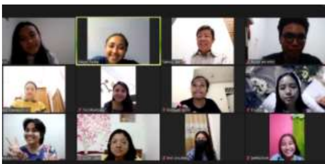
Gambar 1. Ibadah COOL JC menggunakan aplikasi zoom meeting

Salah satu cara yang dilakukan oleh kelompok ialah dengan mengadakan nobar online (nonton bareng online), dimana kelompok menyajikan film rohani yang mengandung nilai-nilai kekristenan di dalamnya berdurasi singkat untuk menarik minat anak-anak JC mendengarkan firman Tuhan. Tim pelaksana menggunakan media zoom meeting untuk beribadah secara online. Tentu kegiatan ini tidak dilakukan setiap saat. Hanya pada saat-saat tertentu saja dan menjadi variasi dalam pembinaan.