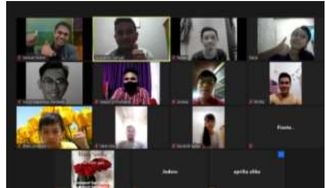
Gambar 3. Pelaksanaan Talkshow di Youth GBI Eben Haezer tanggal

Kegiatan yang dilakukan oleh tim pelaksana memberikan motivasi untuk kreativitas media ibadah. Selama ini gereja hanya mengandalkan pertemuan secara langsung saja. Tetapi dengan kemajuan zaman dan teknologi yang canggih, maka ibadah dapat dilakukan menggunakan media social. Prinsip ini merupakan penginjilan kontekstual ke dalam gereja. Pemuda akan termotivasi untuk hadir dalam ibadah karena mereka mengerti bahwa kehadiran mereka dalam ibadah mendapatkan berkat Tuhan.