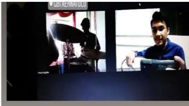
Gambar 5. pelatihan drum secara online

Pertemuan awal ke 1,2 dan ke-3, tim memulai dengan belajar sticking, karena sticking ini melatih kecepatan tangan dan latihan ini sangat penting dalam bermain drum. cukup terlihat dari ketika peserta melakukan latihan, dan kelihatan bahwa peserta menangkap materi yang sudah dipraktekkan dan dicontohkan. Peserta pelatihan memang tidak langsung mahir dalam melakukan praktik sticking, tetapi peserta ditekankan harus belajar di rumah, sewaktu-waktu peserta diluar waktu belajar dan berlatih. Beberapa anak dengan cepat tanggap. Dan seperti materi yang sudah disampaikan dalam kajian teori bahwa sesungguhnya peserta sudah memiliki kemampuan dan skill dari gen peserta masing-masing, yang sudah turun dari orang tua peserta.