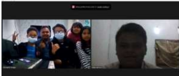
Gambar 4. pertemuan pelatihan musik keyboard