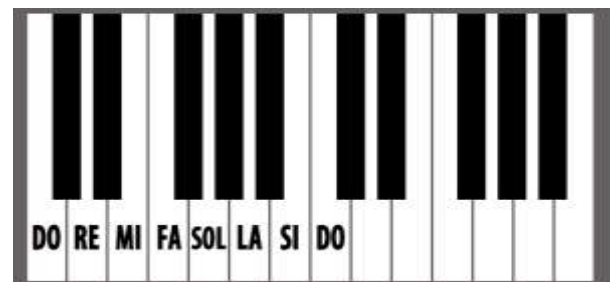
Gambar 3. Model tuts tangga nada